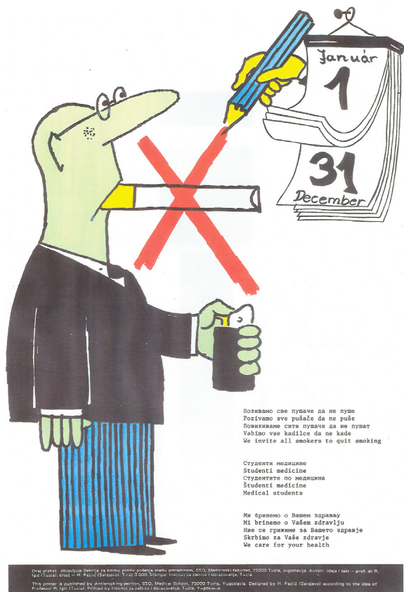
Slika 1. Promociona ilustracija kampanje protiv pušenja studenata Medicinskog fakulteta u Tuzli, rad karikaturiste H. Fazlića, 1982.

da se pošalju u mirovinu ili zabrane sve reklame za duhan na svim mjestima.